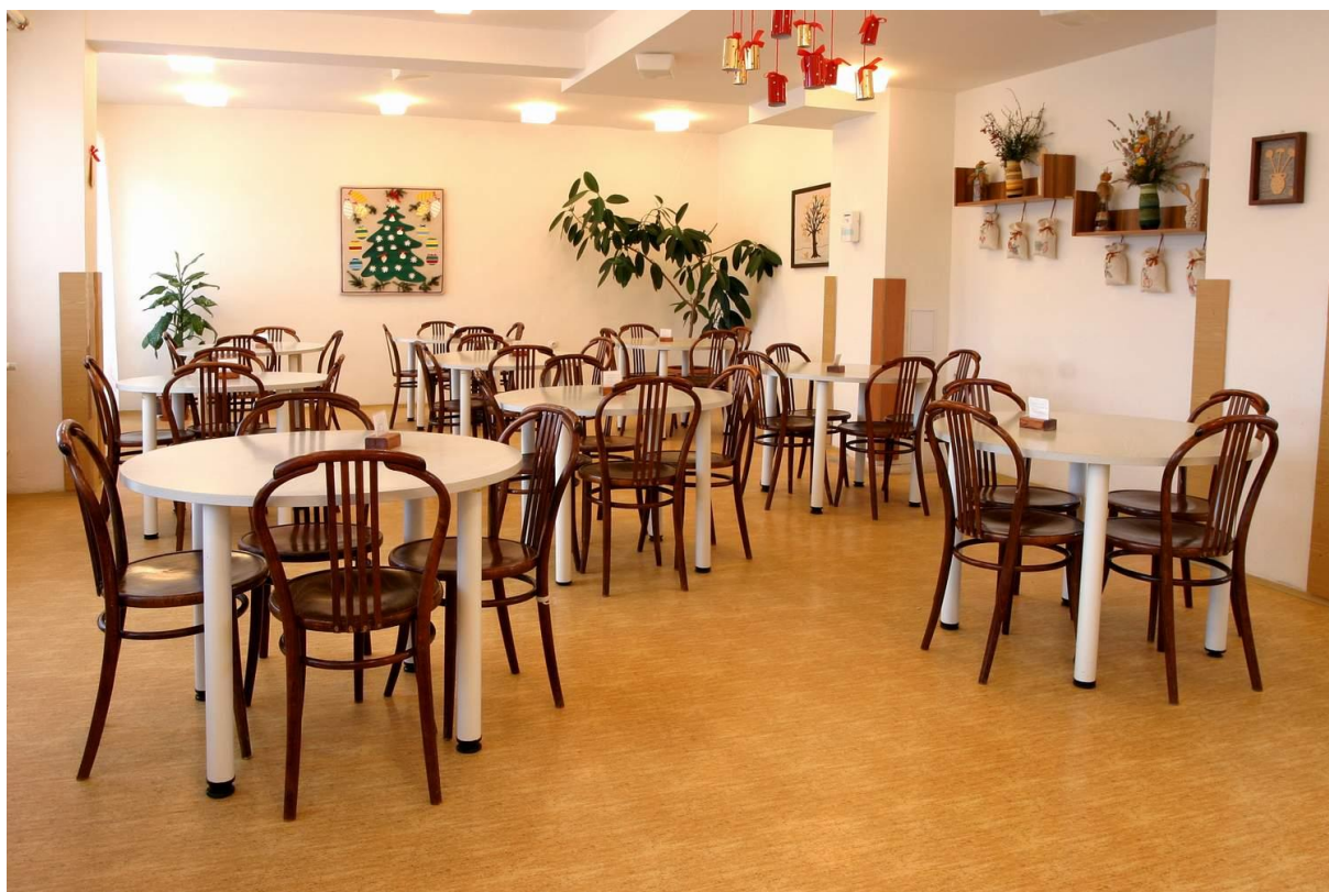
Jedna z jídelen pro uživatele

Uživatelé mají možnost se kdykoli se vyjádřit ke kvalitě podávané stravy prostřednictvím stravovacích komisí, které jsou složeny z volených zástupců daného domova či oddělení a vždy za účasti vedoucí stravovacího úseku. Jednání komise je zakončeno zápisem, který je předán ředitelce pro případné řešení stížností či podnětů od uživatelů.