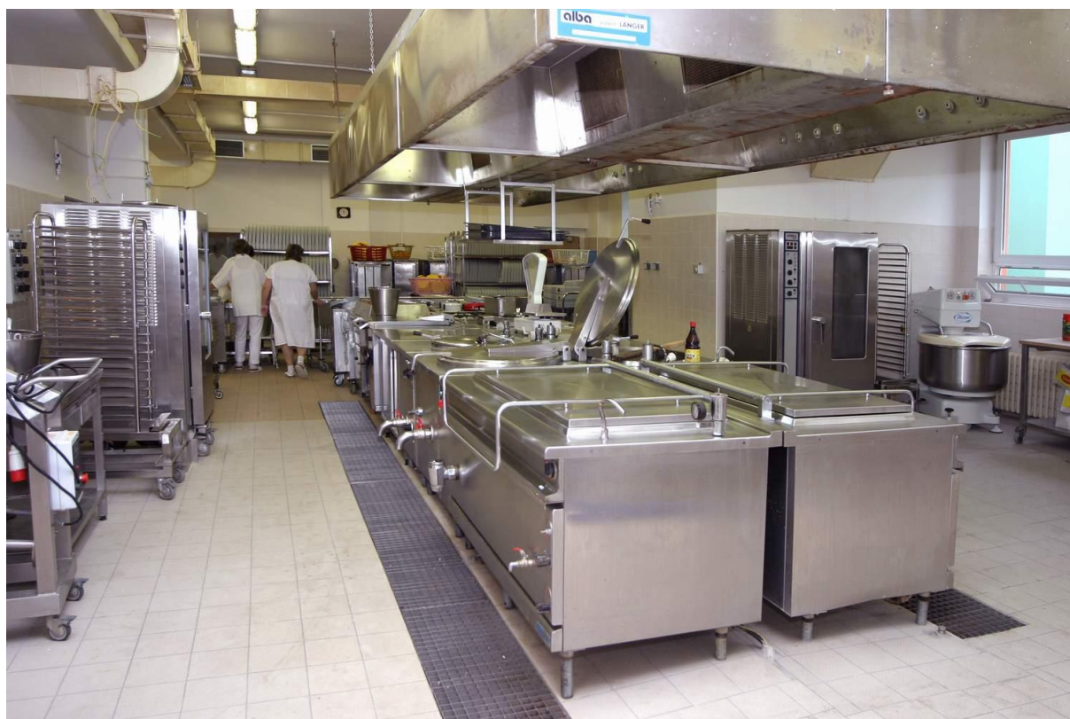
Kuchyně Domova Harmonie

V prosinci roku 2008 byly některé pokoje na pavilonu E vybaveny komunikačním zařízením sestra – pacient. Akce byla realizována s investičním příspěvkem zřizovatele ve výši 550 000 Kč.